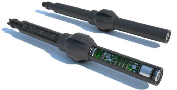
Keller DCX25 PT Tool